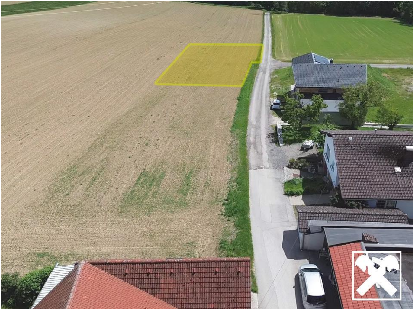
Grundstück Igelschwang_747m 2