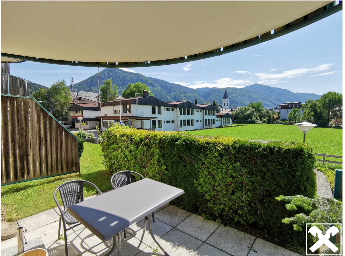
Terrasse mit Blick ins Grüne