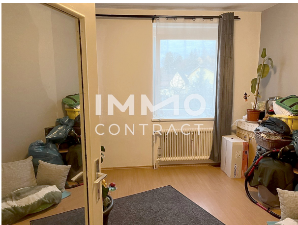
Wohnung Tür 4