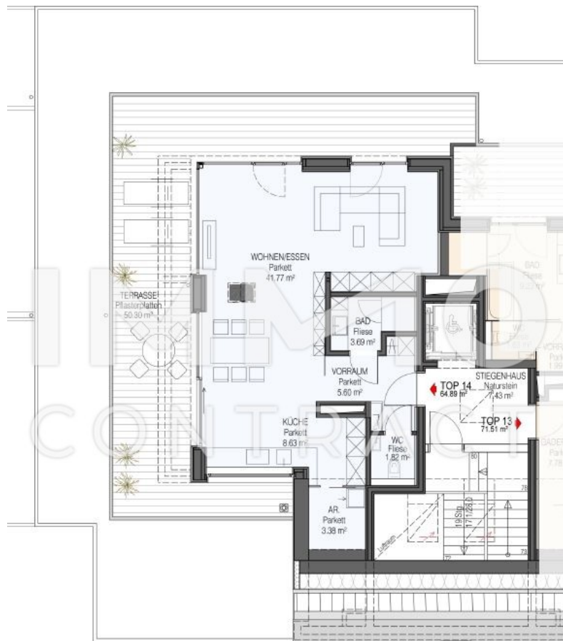
WB1 TOP 14 64.89m²