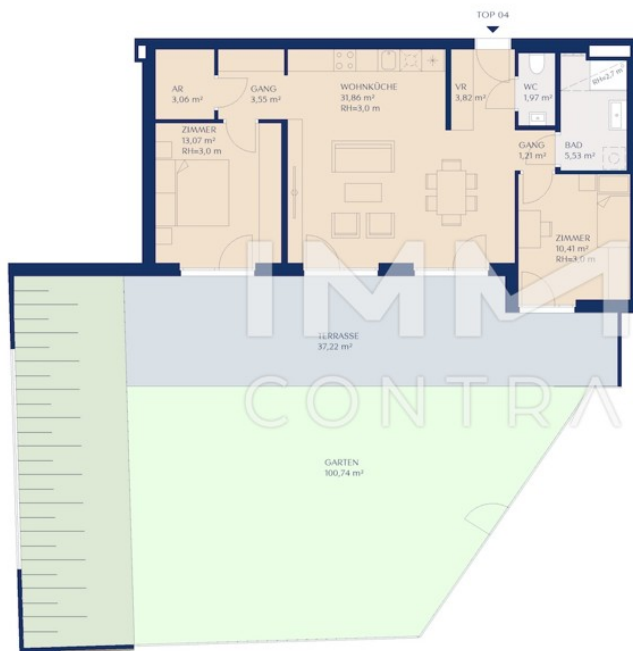
LAGE TOP 04 | HAUS E