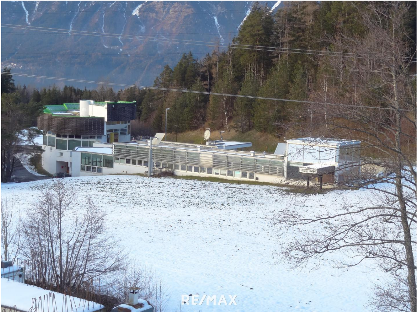
"Bartenbach" - Lacknerbau und Laborgebäude