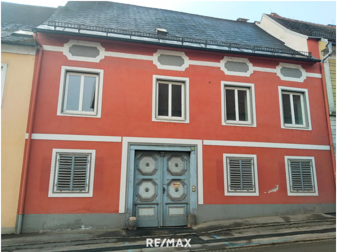
Haus Front Ansicht