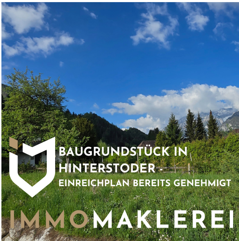
TITELBILD 66 Baugrund Hinterstoder