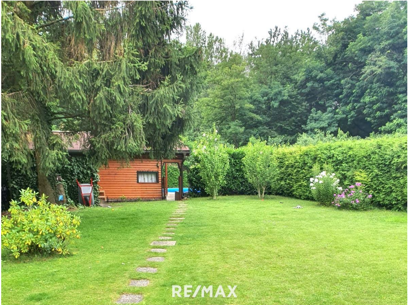
Garten im Sommer