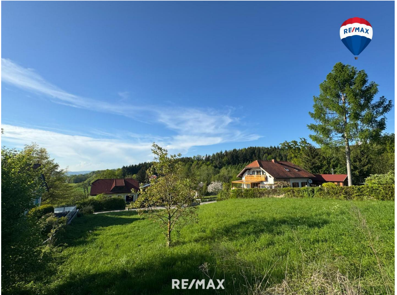
Titelbild Ballon Richtung Westen

>>> VERKAUFT !!! <<< Baugrundstück in Schartner Ruhelage - mit Aussicht und ohne Bauzwang