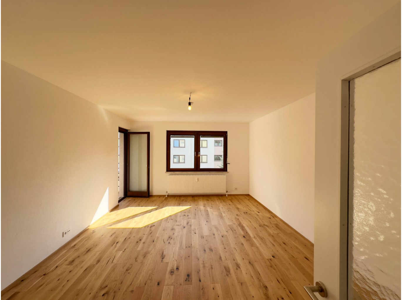
Wohnzimmer, 4-Zimmerwohnung Kufstein-Zell