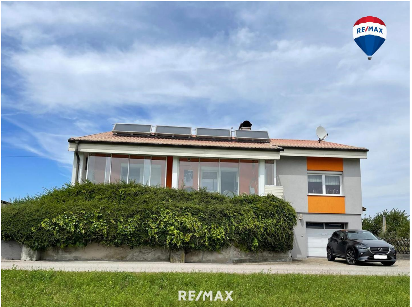
Titelbild Ballon - Südansicht

>>> VERKAUFT ! <<< Sanierter Bungalow in Grün- und Ruhelage