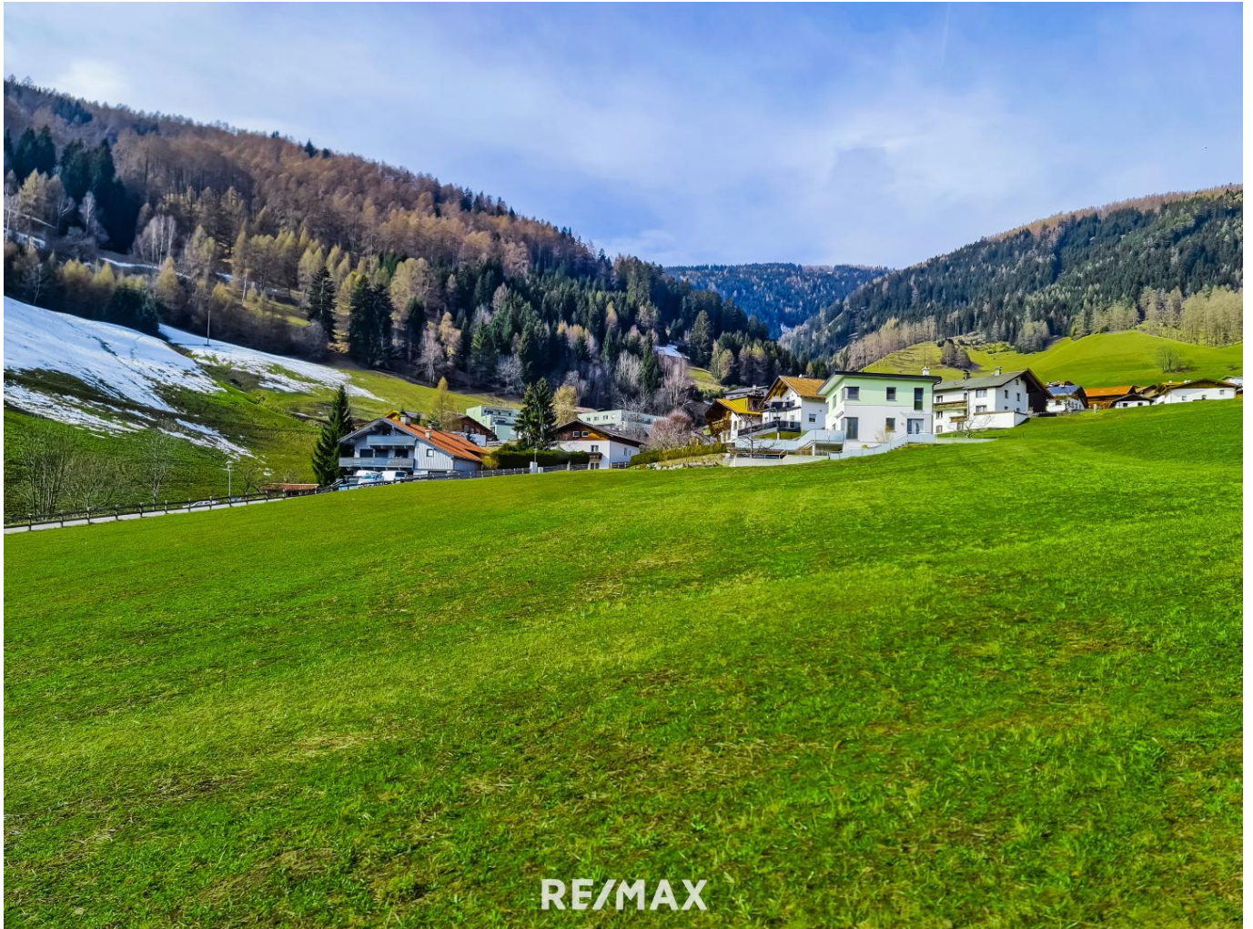
Grundstück Matrei am Brenner

Objektnummer: 1613_11018 Eine Immobilie von RE/MAX Recon