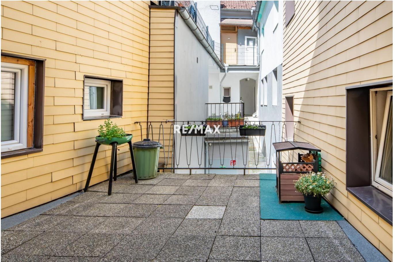
Terrasse 1. OG