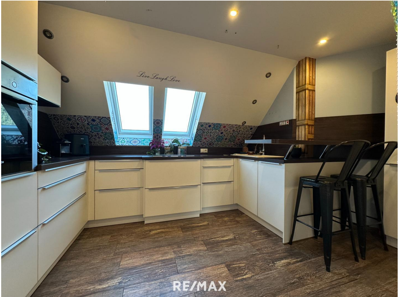
Wohnung - Blick von der Terrasse

Objektnummer: 1613_11057 Eine Immobilie von RE/MAX Recon