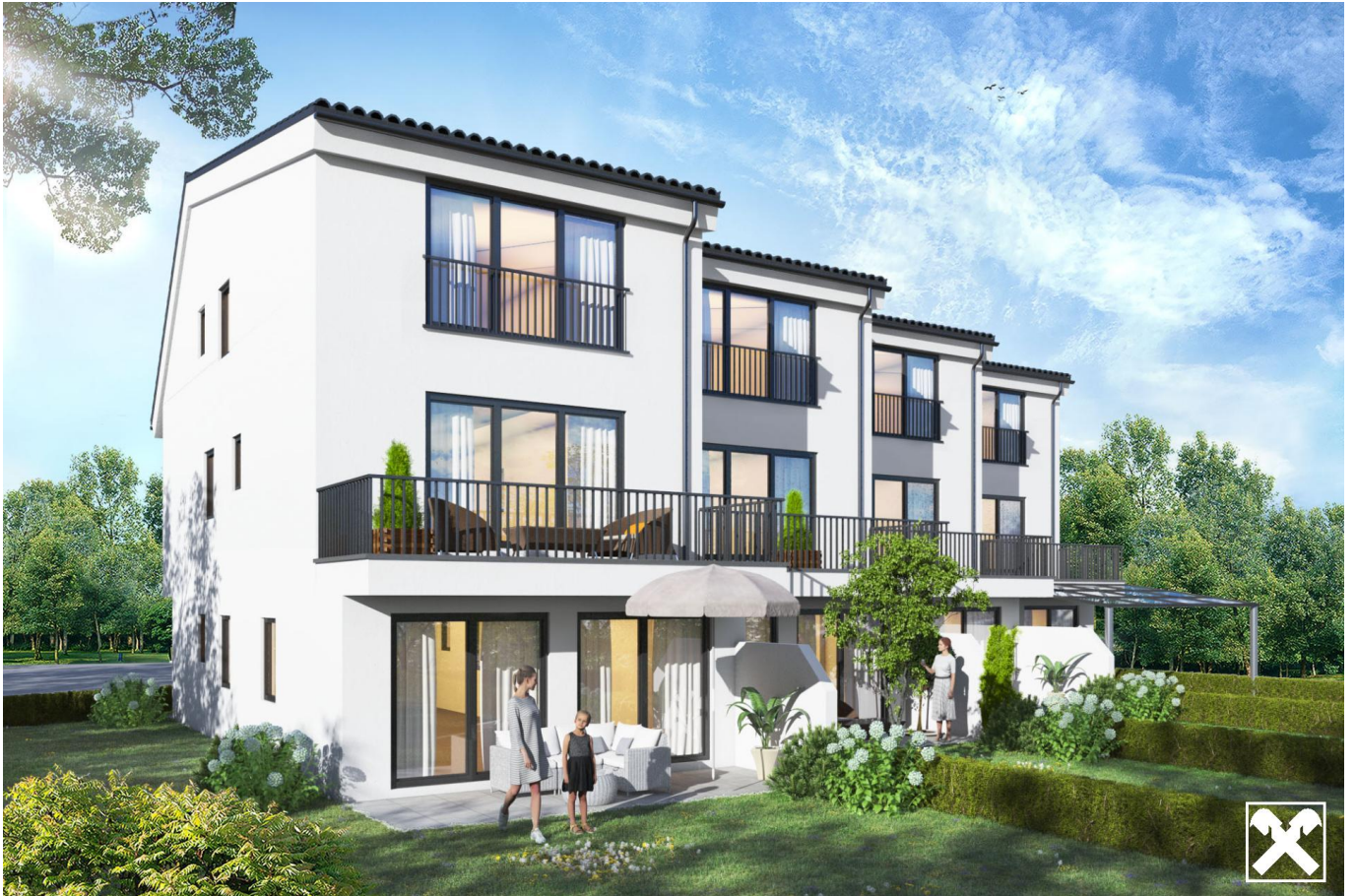
Ansicht 2 Reihenhäuser