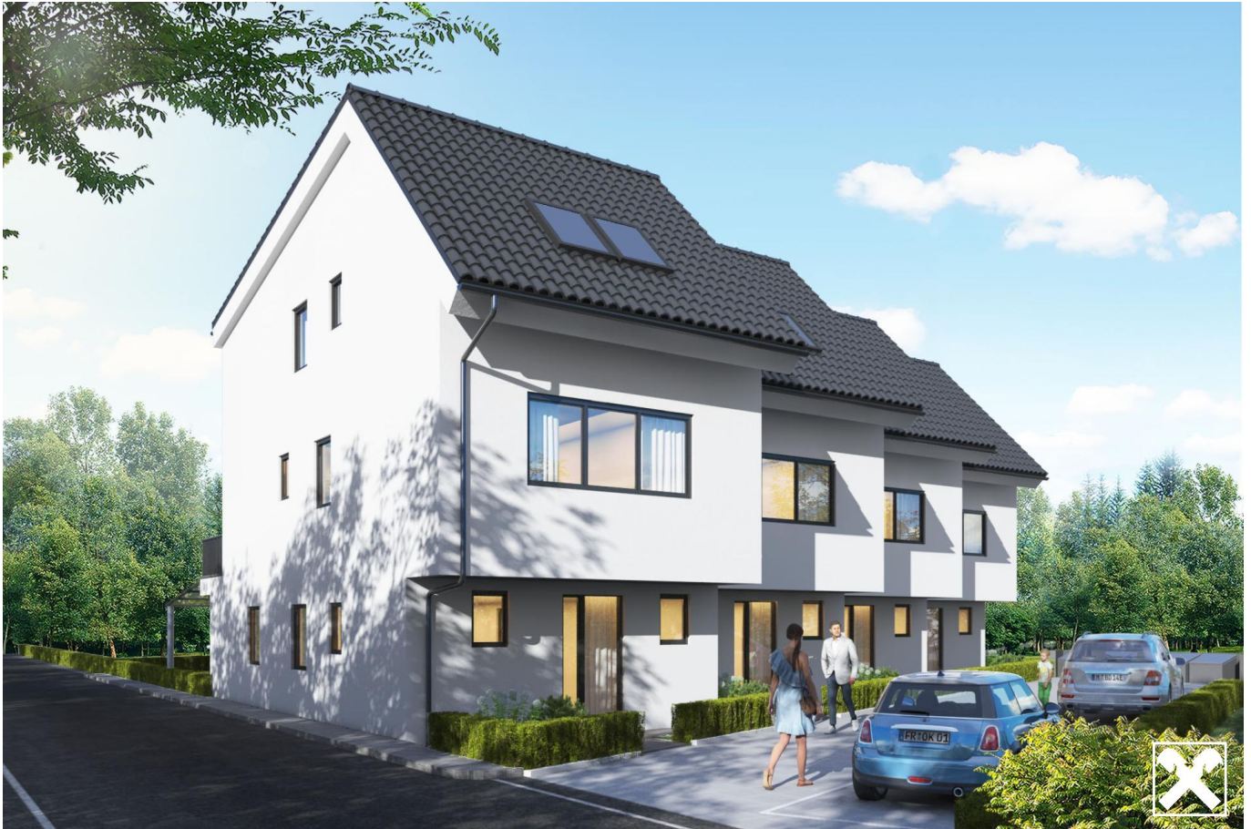
Ansicht 1 Reihenhäuser