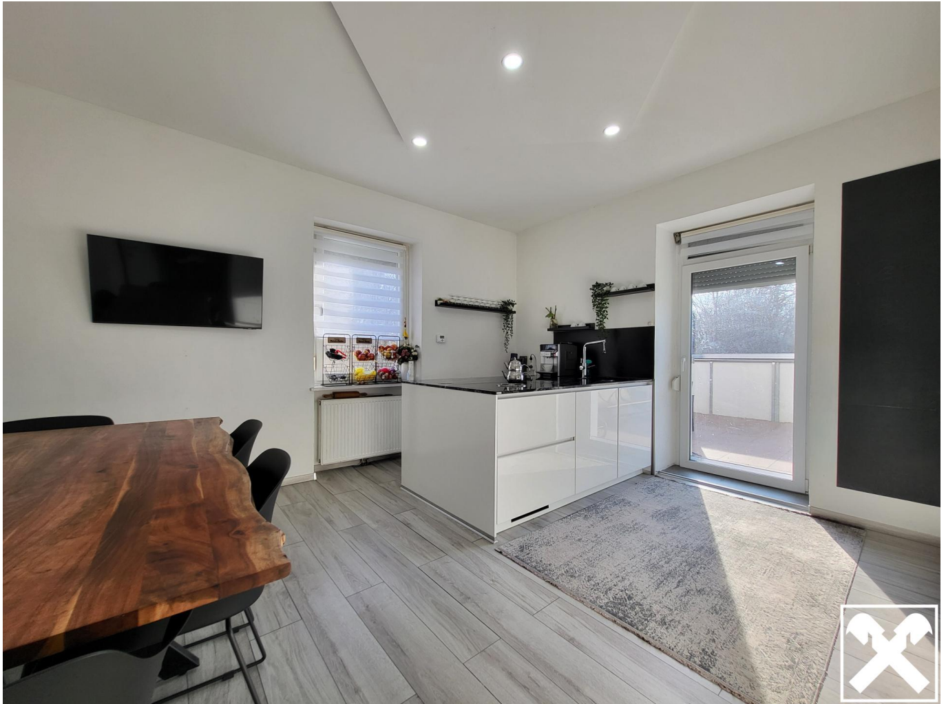
Küche Top 1_EG