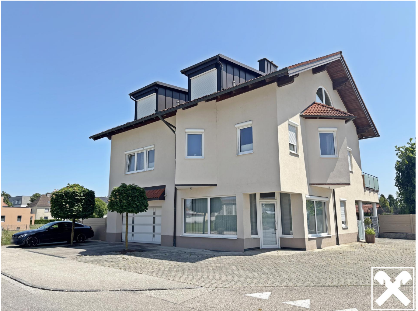
Wohn- und Geschäftshaus