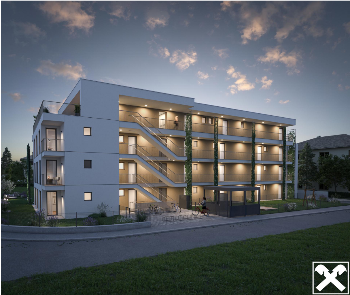
Visualisierung Algunder Straße Back