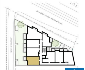
ORIENTIERUNGSPLAN | +1 OBERGESCH.

2025.03.11 | D02 WOHNUNGSPLAN | DS104_A00_PP_X0