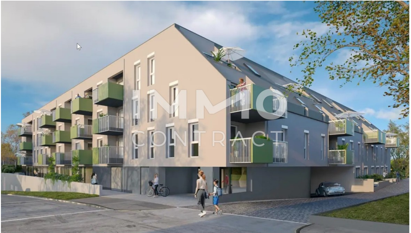
Ansicht Haus aussen