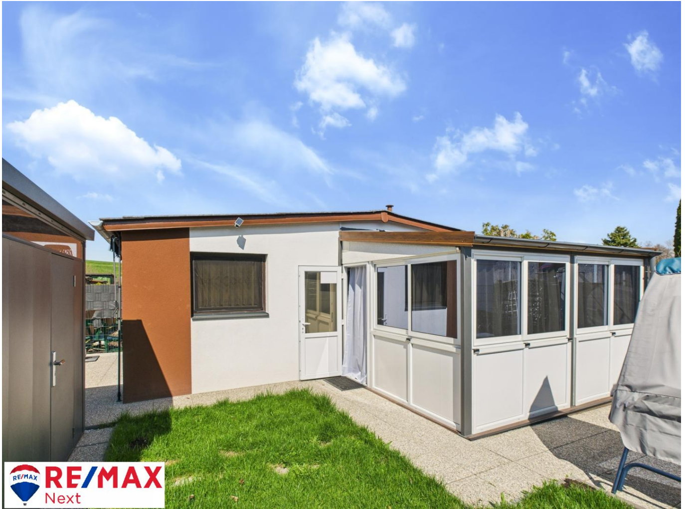
Mobilheim mit Garten