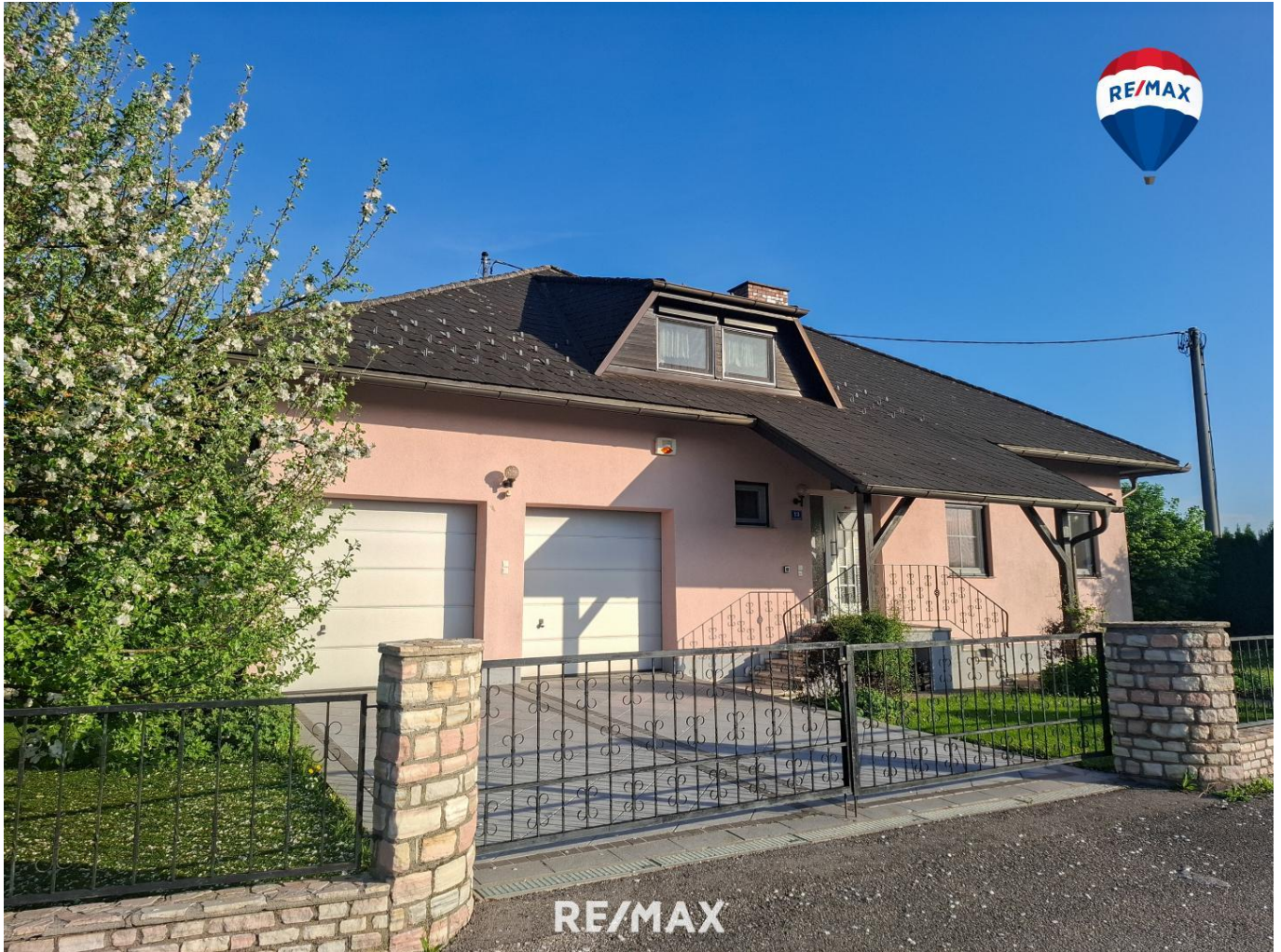
Titelbild - Ansicht Nord-West

>>> VERKAUFT ! <<< Geräumiger Bungalow mit gepflegtem Garten