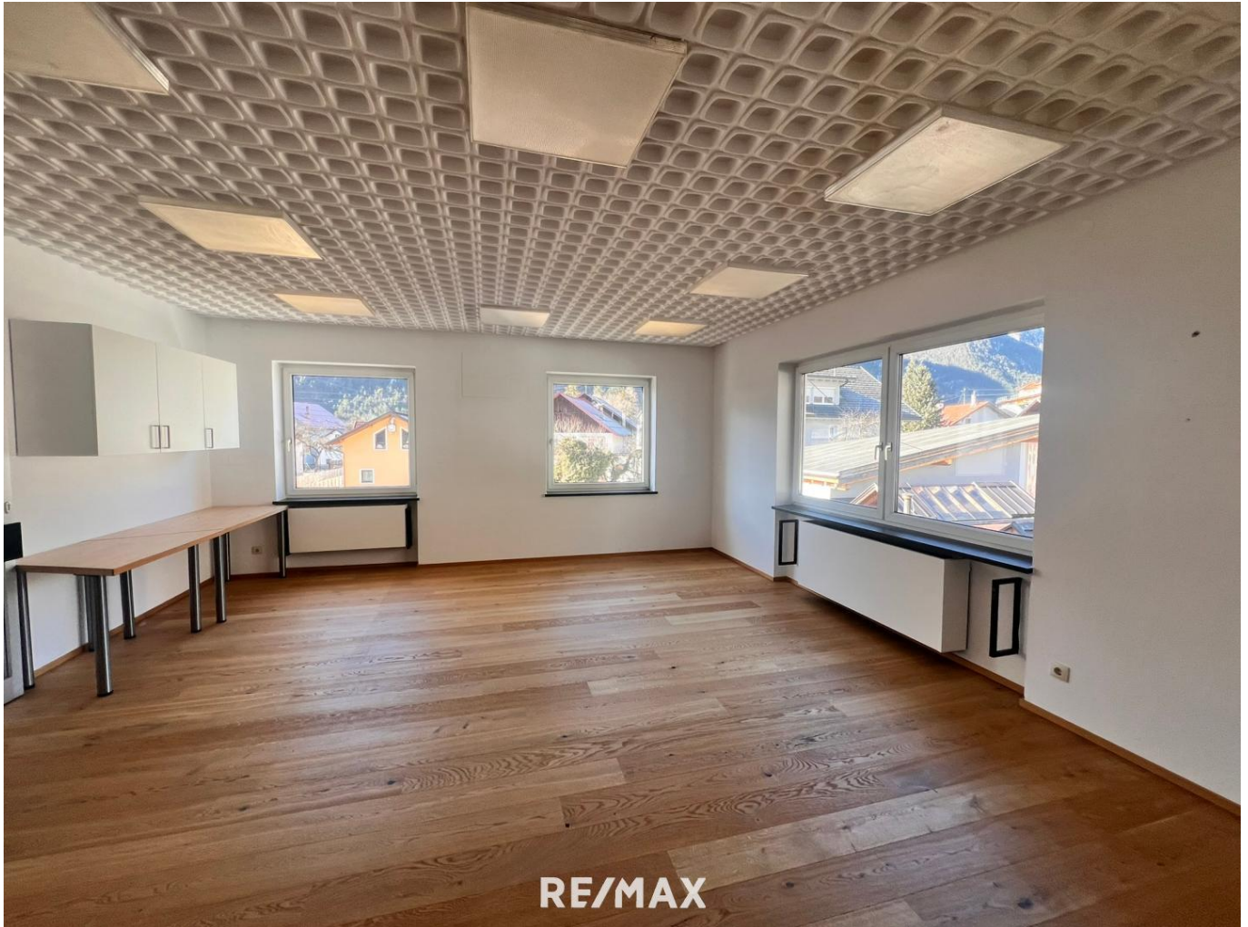
Büro mit Aussicht