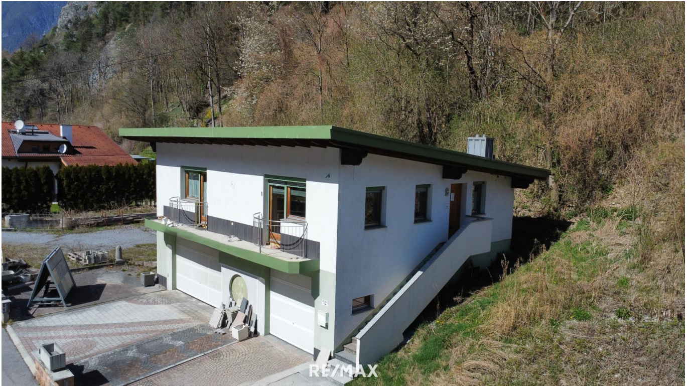
Haus - Außenansicht

Objektnummer: 1613_11099 Eine Immobilie von RE/MAX Recon