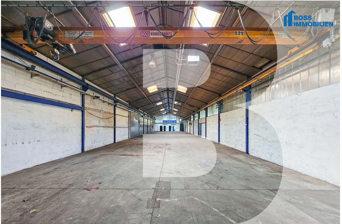
01 Titelbild Halle B