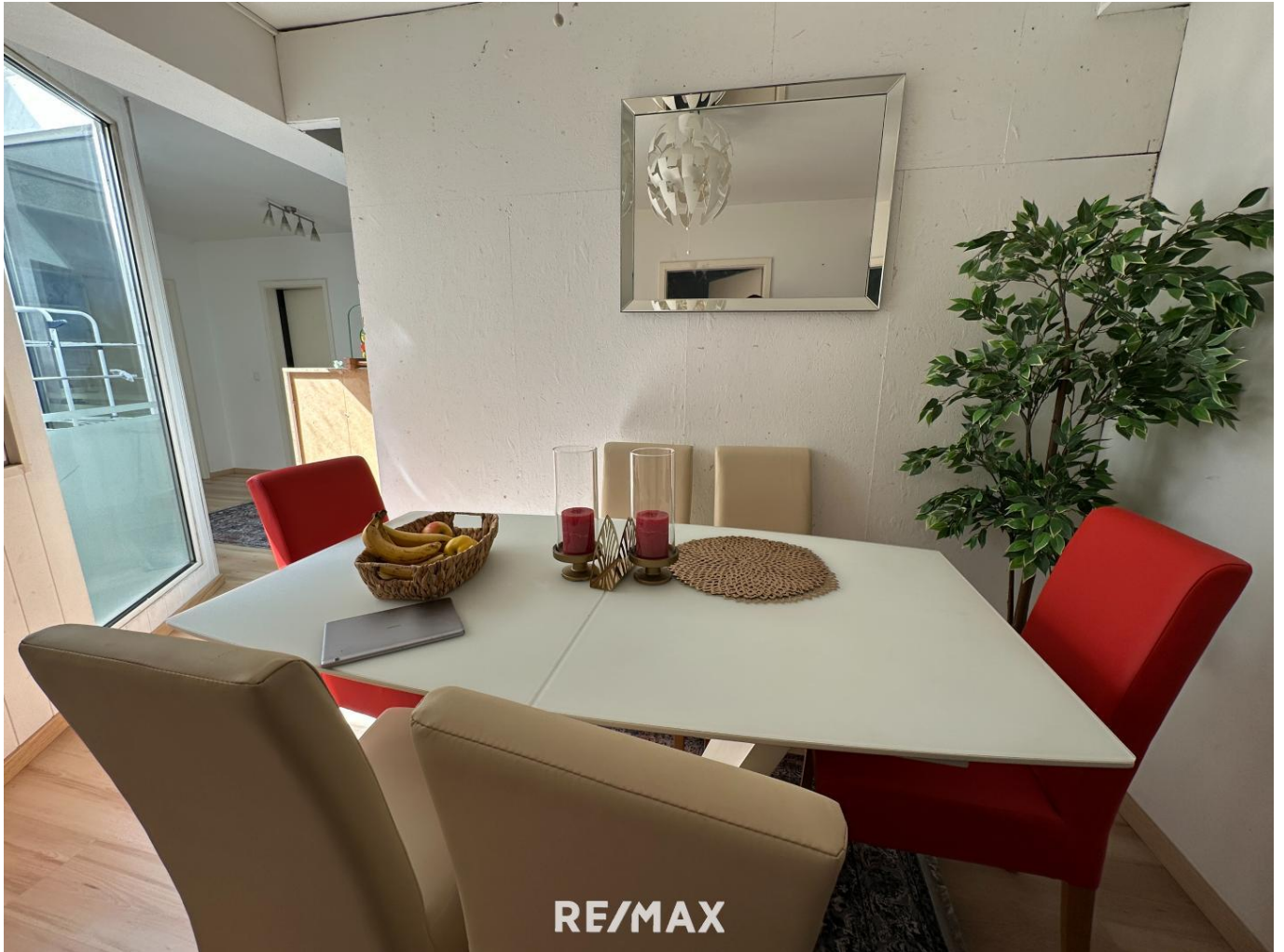
Wohnung - Essbereich

Objektnummer: 1613_10313 Eine Immobilie von RE/MAX Recon