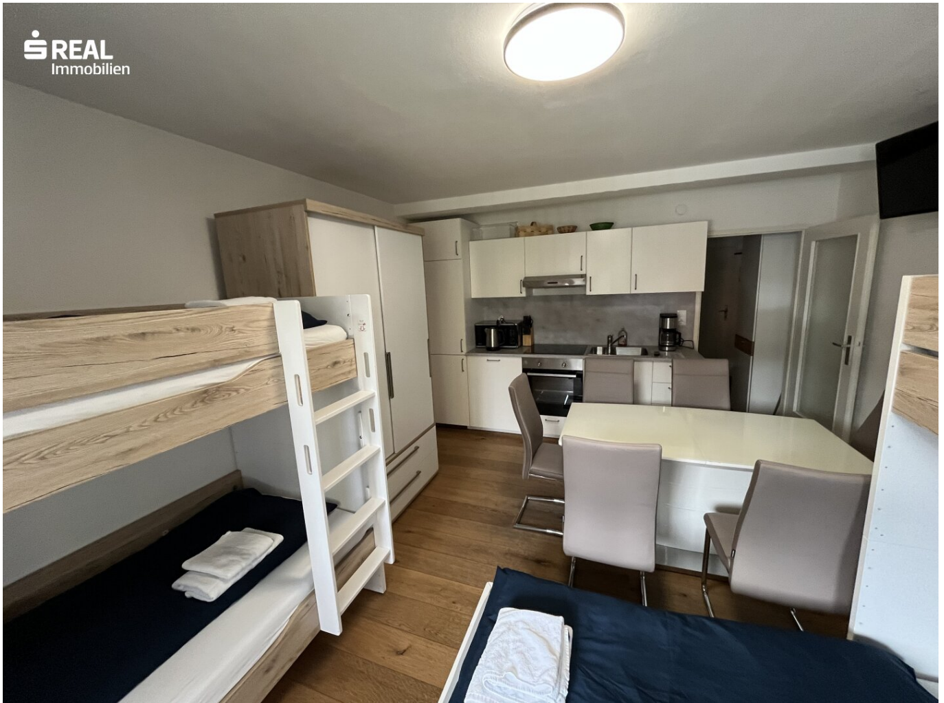
Wohnraum mit Küchenzeile