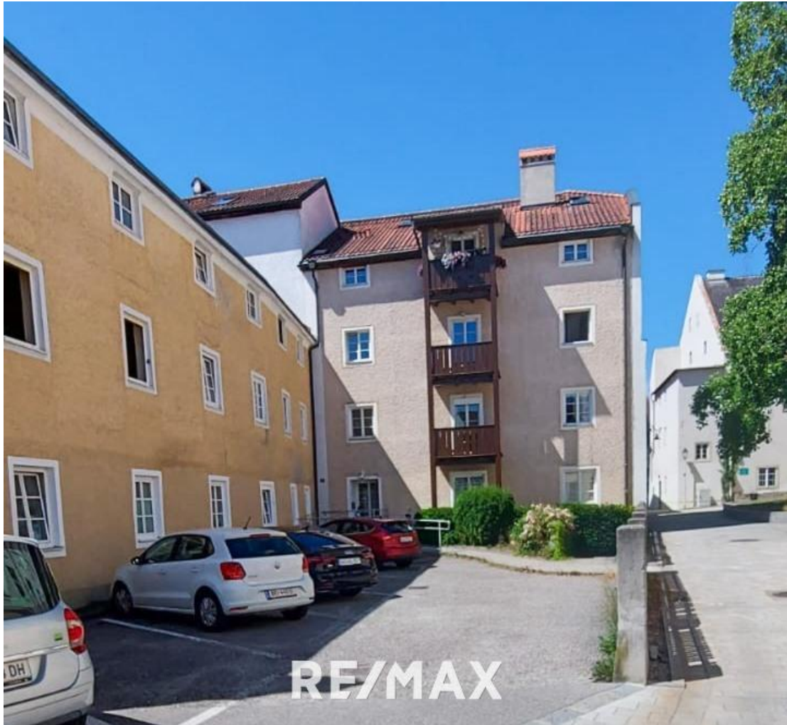
3-Zimmer Wohnung in Braunau Zentrum