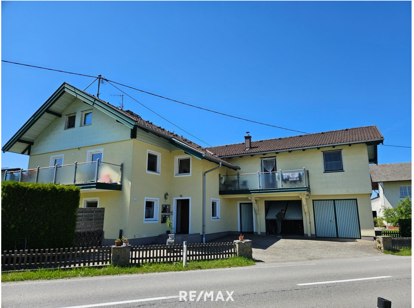
Haus mit 4 Wohnungen in Burgkirchen