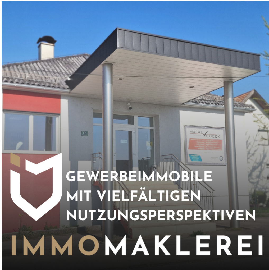
TITELBILD Metal Check