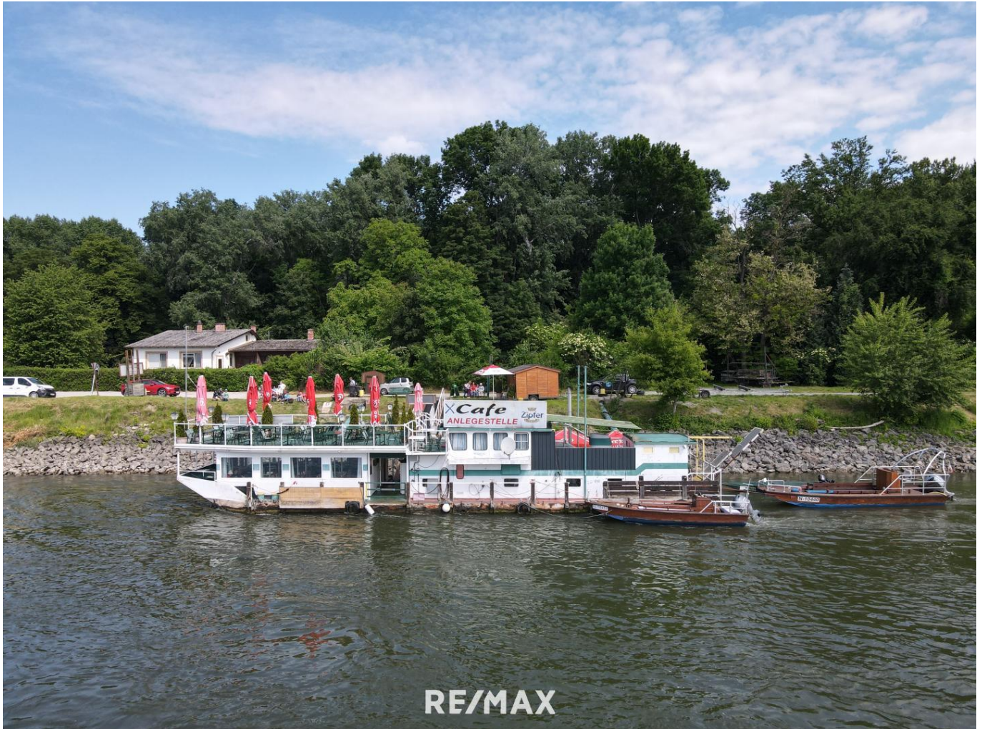
Boot mit Restaurant