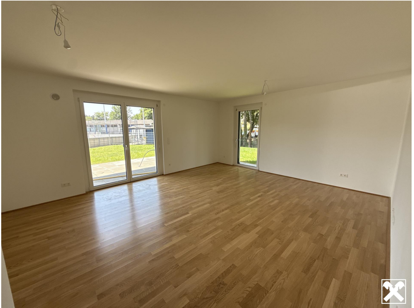
Top 1 Wohnbereich