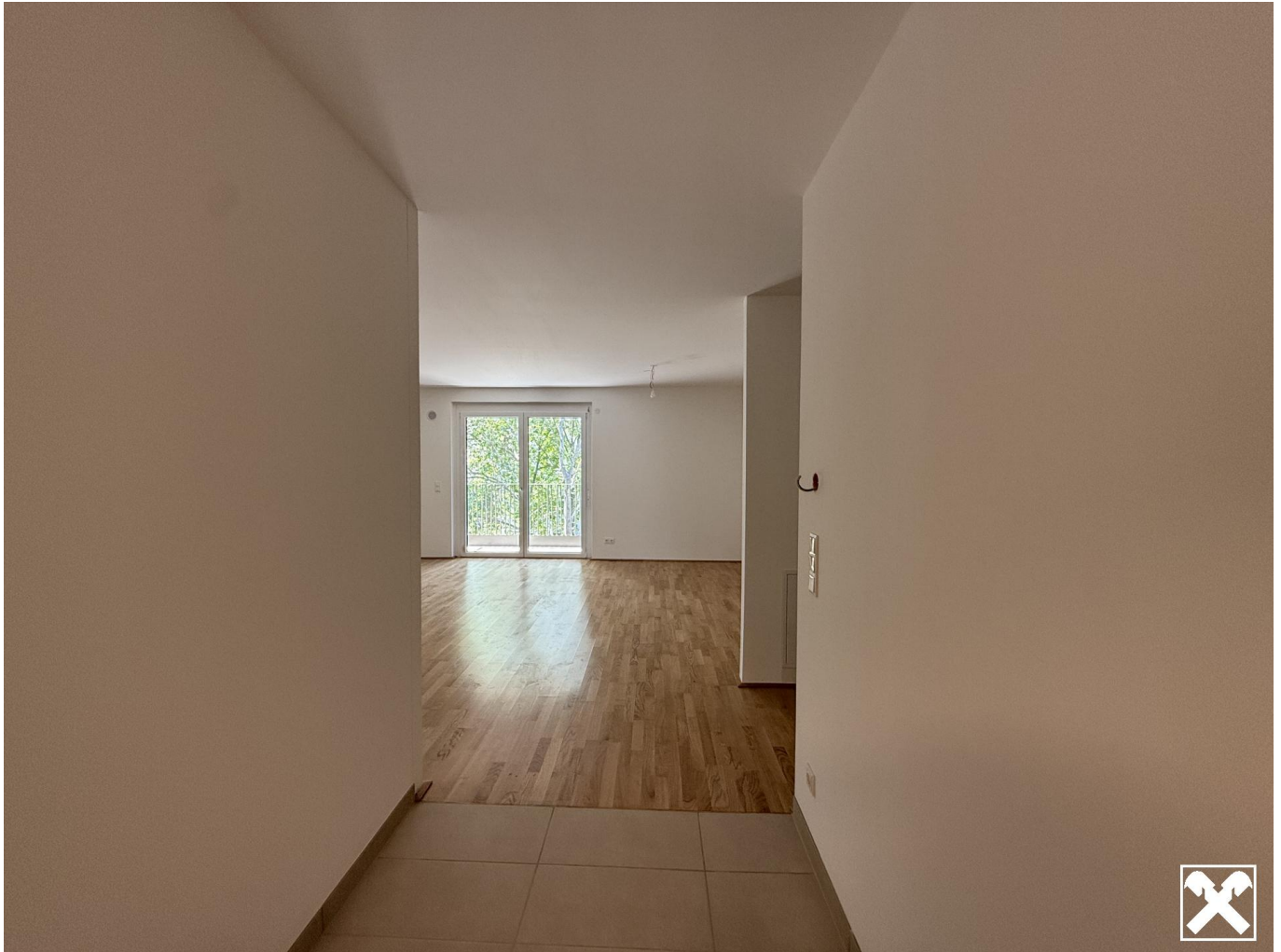
Top 7 Eingangsbereich