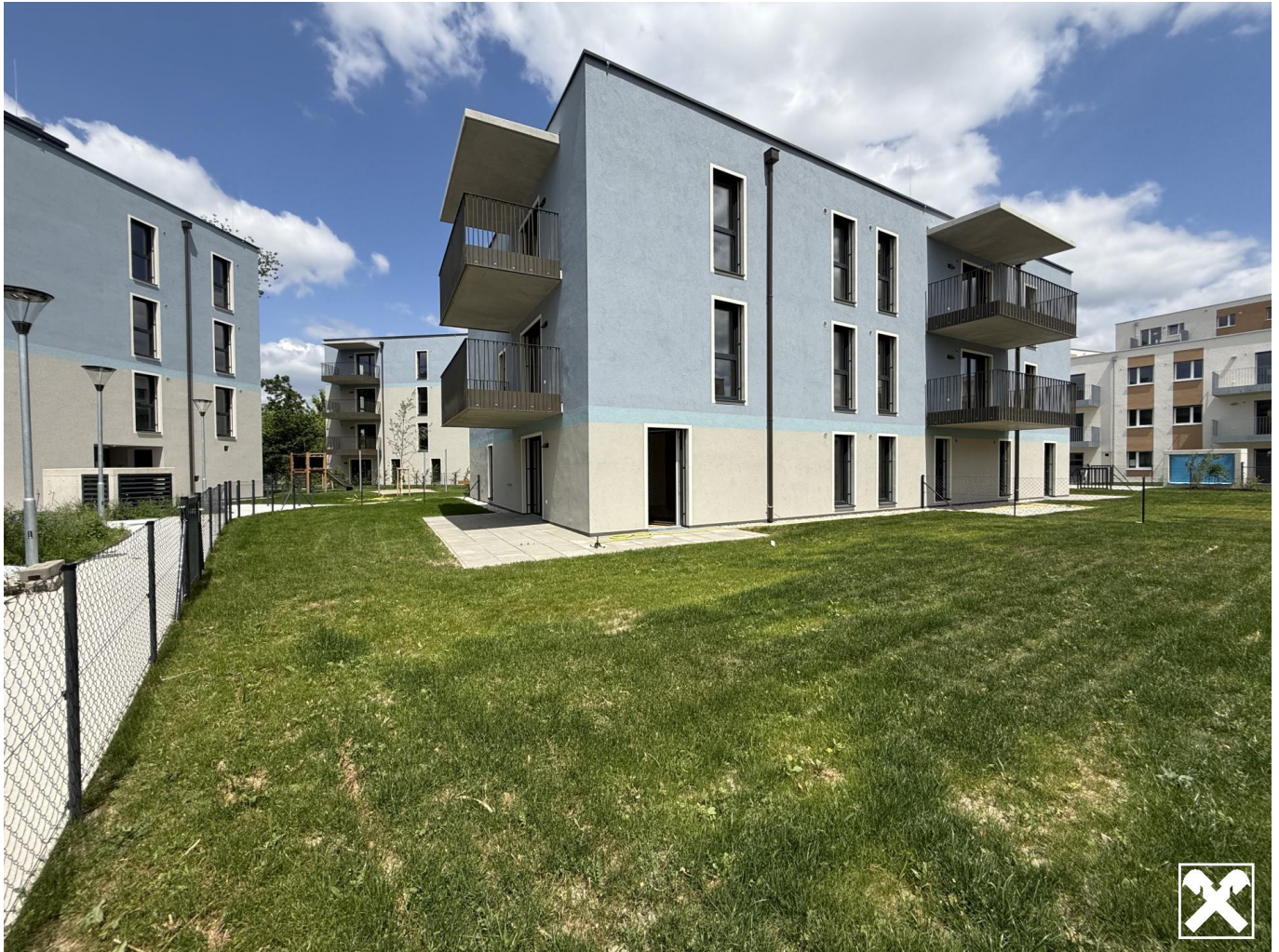
Top 2 Garten (3)