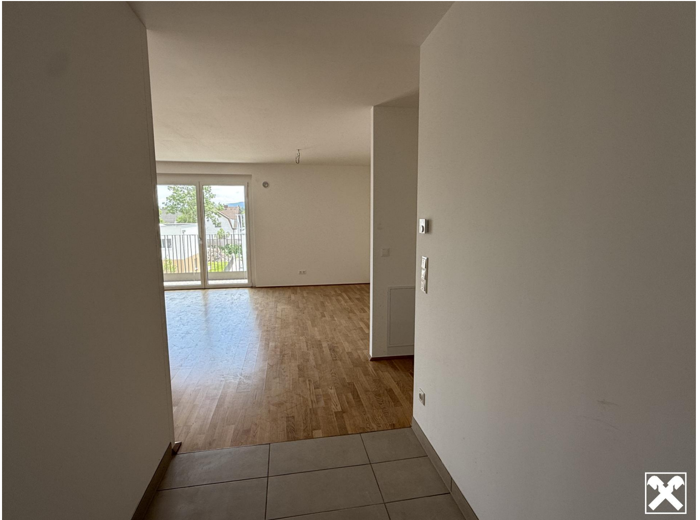
Top 7 Eingangsbereich