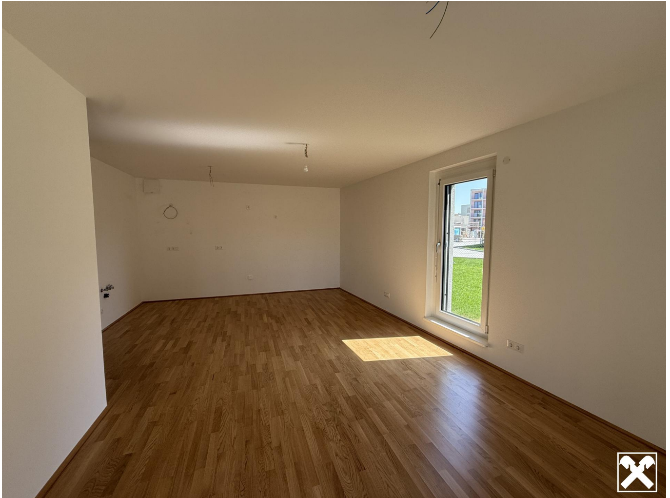
Top 1 Wohnbereich