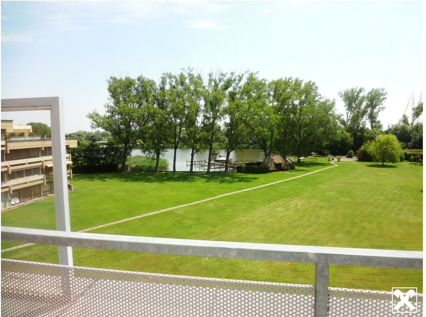
Seeblick von der großen Terrasse