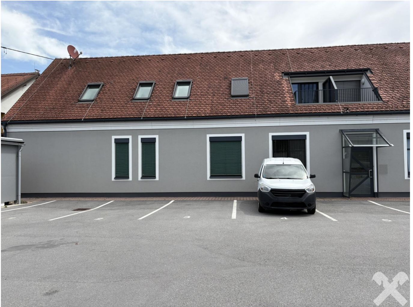
Eingangsbereich mit Parkplätzen