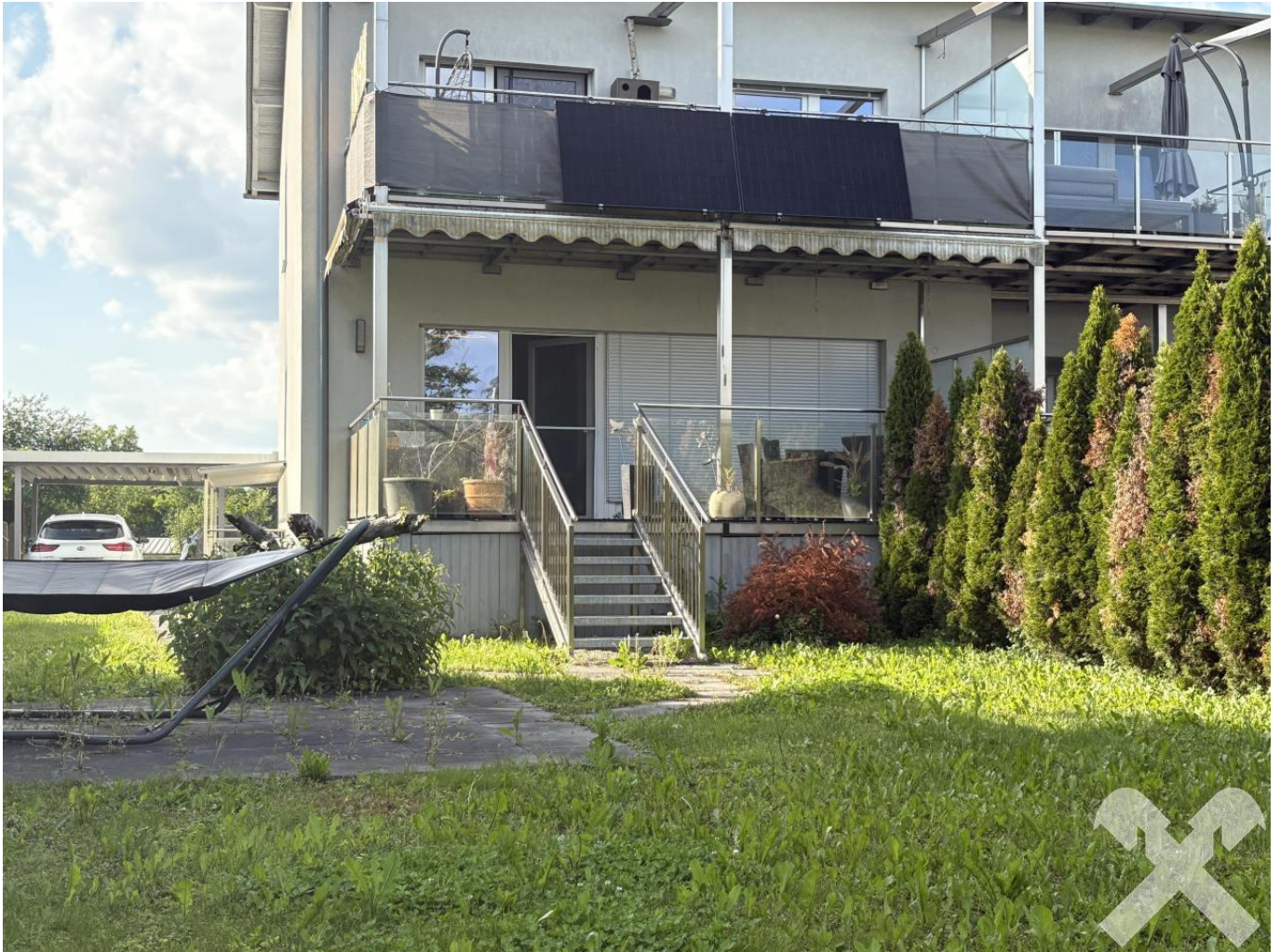
Terrasse und Garten