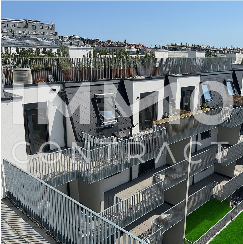
Projekt von Dachterrasse

Das Vivara! Familienfreundlich, modern, provisionsfrei