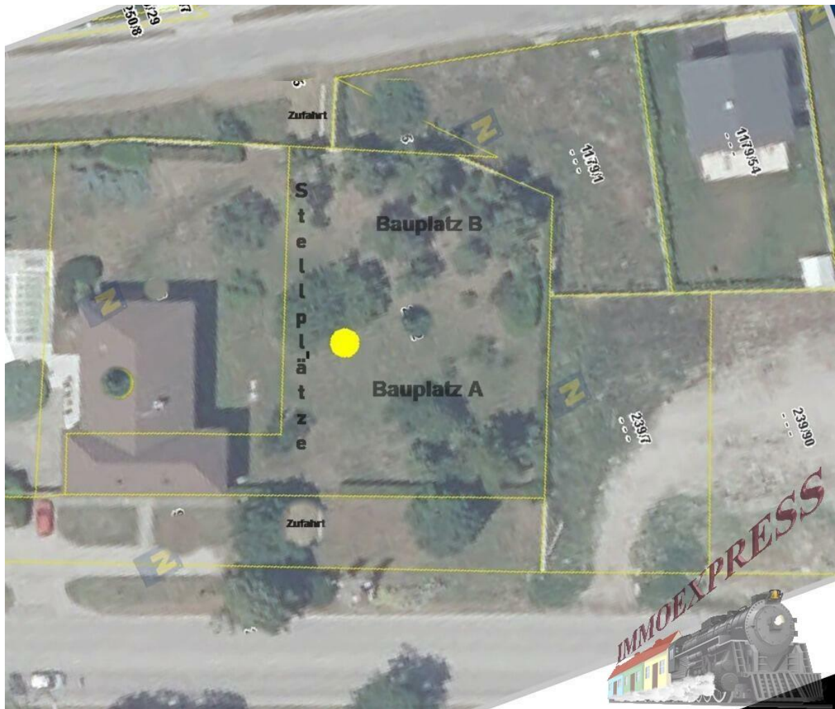
Luftbild Bauplatz A+B