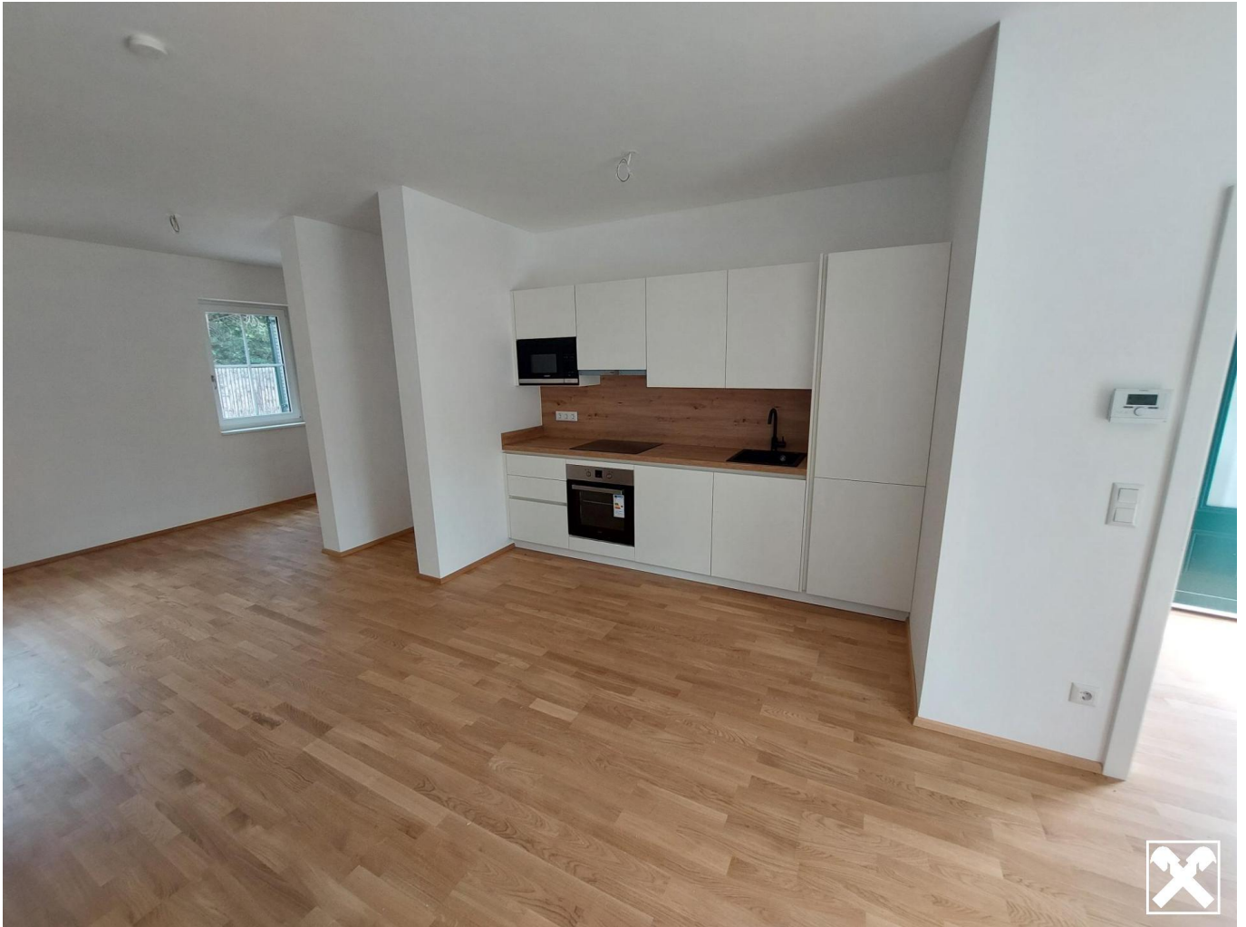
Wohnzimmer mit Küchenzeile