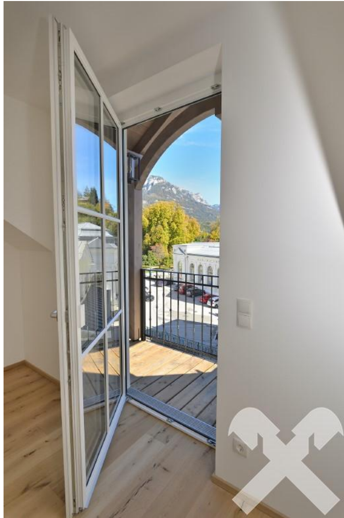
Zugang zu Balkon