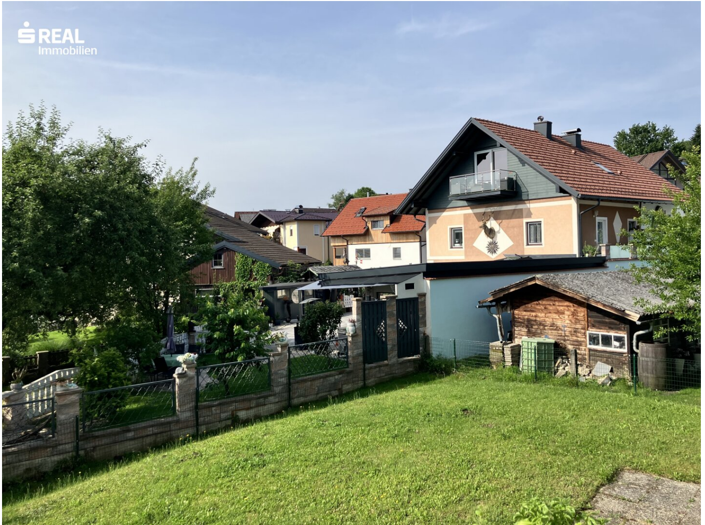
Ausblick von der Loggia_a