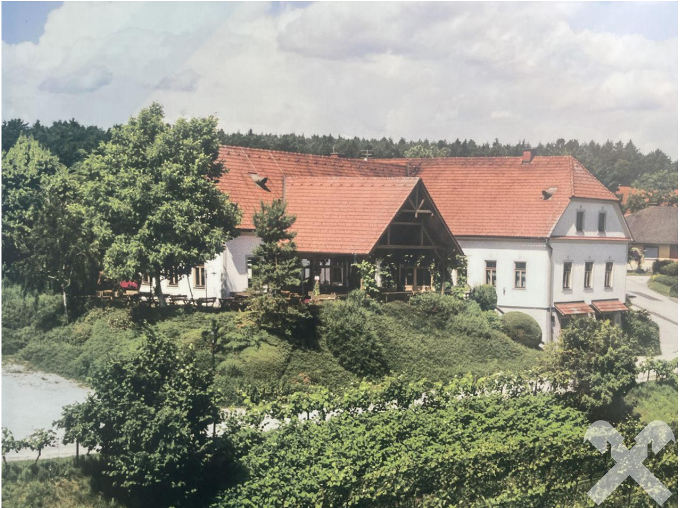
Wirtshaus Heuriger Bergstadl