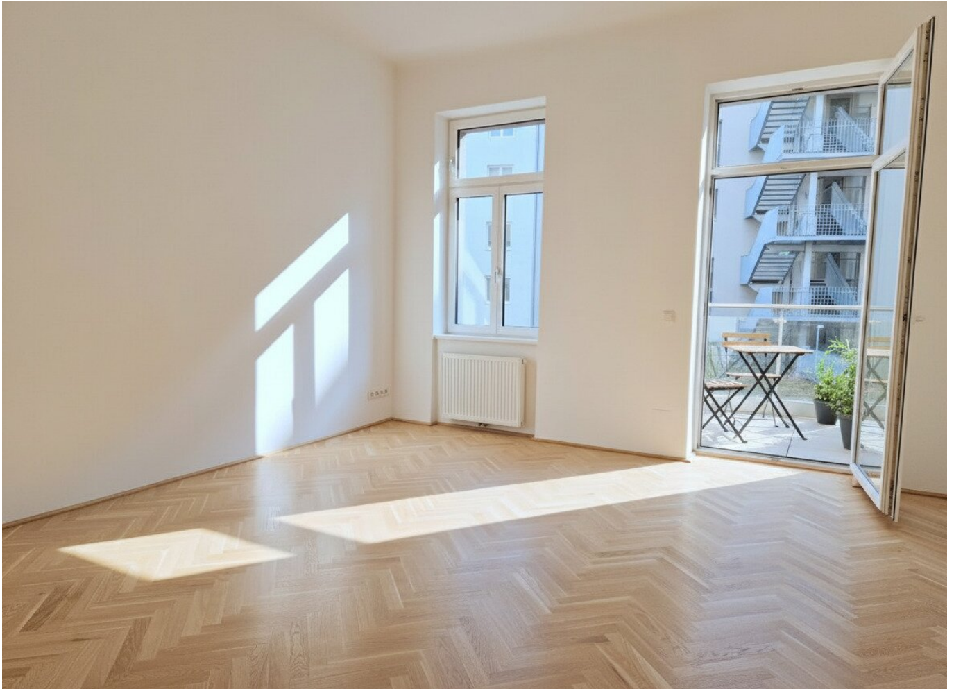
Wohnzimmer mit Balkonanimation