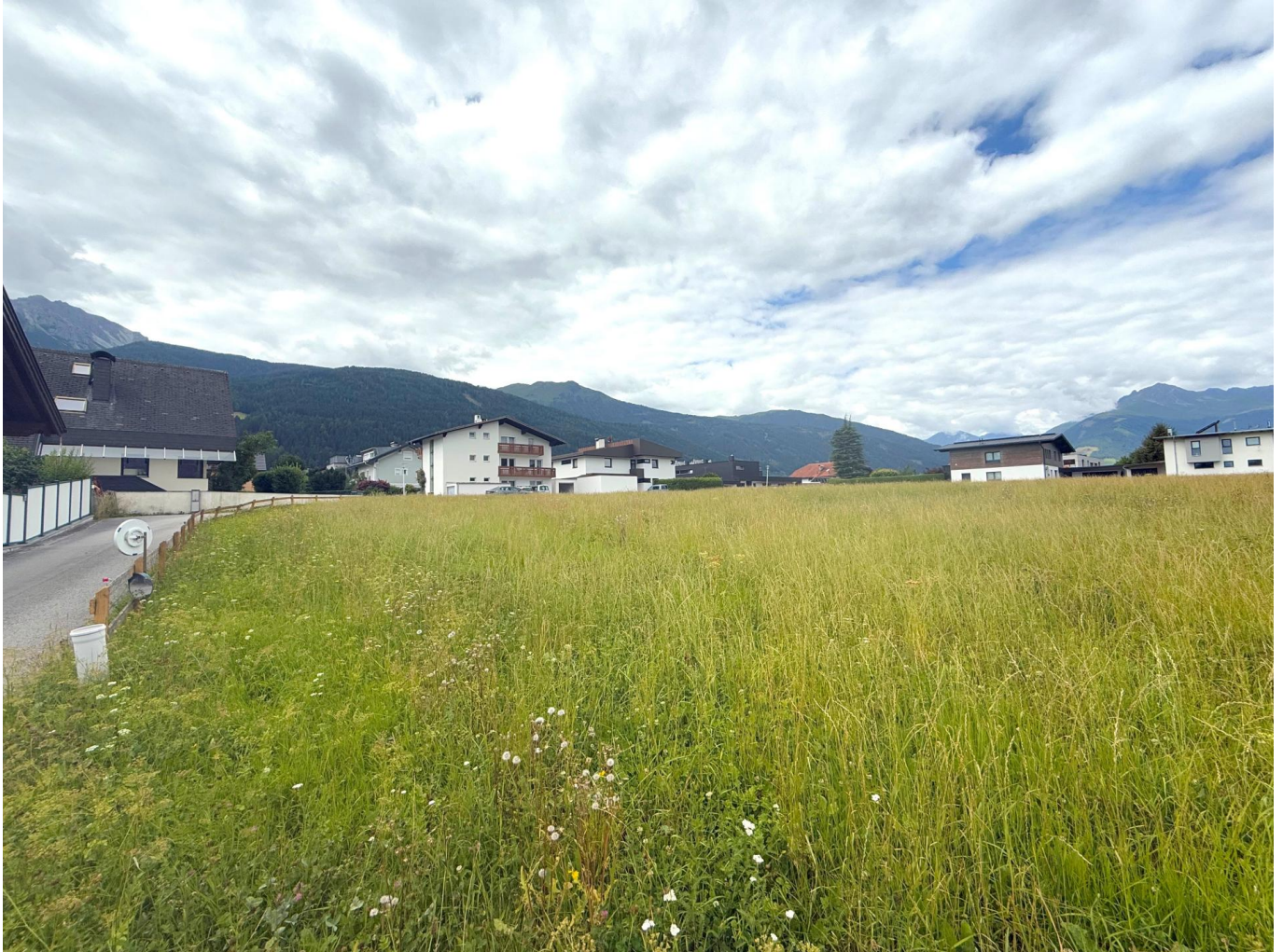
Grundstück & Umgebung