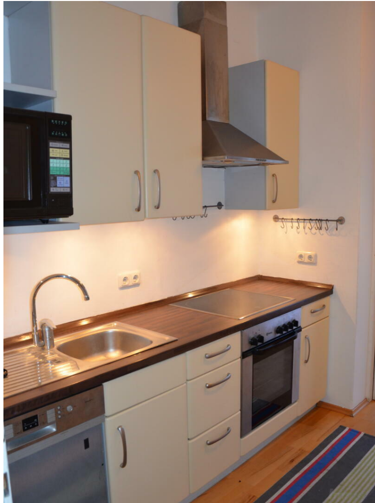
Küche komplett ausgestattet